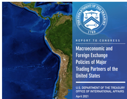
자료: U.S. Department of the Treasury